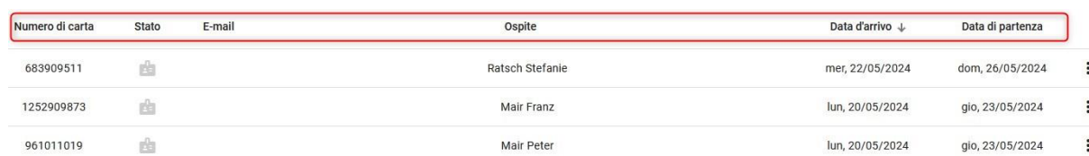
Fig.: Elenco delle carte

Se ha qualche domanda, non esiti a contattare il suo ufficio turistico.